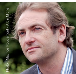
Didier VAN CAUWELAERT Parrain des mots Doubs 2009

← Comment venir à la Fête du livre du Doubs ?