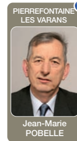
PIERREFONTAINE LES VARANS